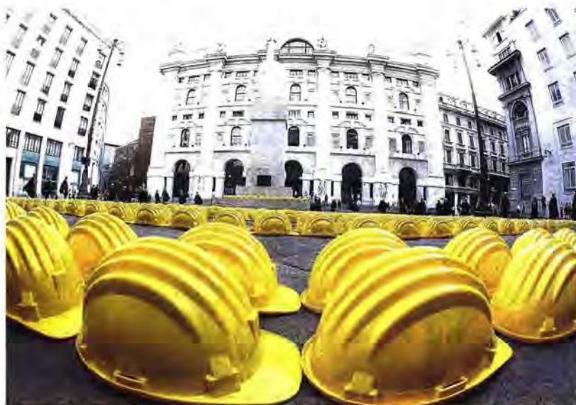
Edilizia al collasso. I caschetti gialli tornano in Piazza Affari a Milano. questa volta nel mirino delle imprese c'è l'apparato burocratico-amministrativo

Le imprese: vogliamo essere liberati dalle vessazioni che ogni giorno subiamo e che sono una zavorra insostenibile per ripartire