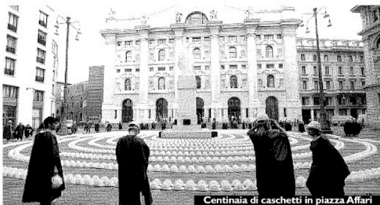
Centinaia di caschetti in piazza Affari

I costruttori edili hanno protestato in piazza Affari contro le vessazioni che danneggiano il settore: troppe regole che impediscono di lavorare e non garantiscono la legalità. In Lombardia il comparto ha perso in poco tempo 50mila posti di lavoro. L'anno scorso hanno chiuso 2.584 imprese