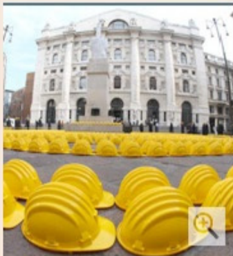
I caschetti gialli degli edili esposti sulla piazza durante la "Giornata della Collera - Le Vessazioni" organizzata dal mondo delle costruzioni in piazza Affari.

Tornano i caschetti gialli, simbolo della crisi che sta devastando il settore dell'edilizia. Di nuovo a Milano, di nuovo in Piazza Affari. Come lo scorso 13 febbraio, quando la filiera delle costruzioni, guidata da Assimpredil Ance (i costruttori di Milano, Lodi, Monza e Brianza), diede vita alla giornata della collera, ieri quelle stesse associazioni più altre che hanno aderito all'appello, hanno organizzato la giornata delle vessazioni.