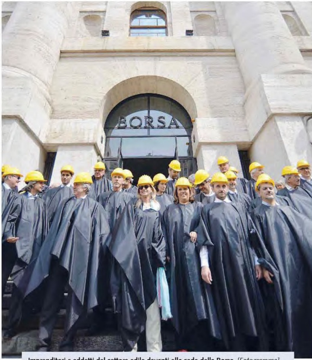
Imprenditori e addetti del settore edile davanti alla sede della Borsa